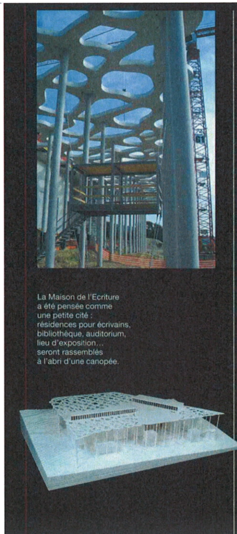
La Maison de l'Écriture a été pensée comme une petite cité : résidences pour écrivains, bibliothèque, auditorium, lieu d'exposition... seront rassemblés à l'abri d'une canopée.

Le Prix Jan Michalski, lui, fait déjà figure de référence : «Seuls les membres du jury peuvent proposer des livres, au maximum deux chacun. Cinq ouvrages sont encore en lice, on connaîtra le nom du vainqueur en novembre», conclut Vera, en déposant délicatement son casque de chantier.